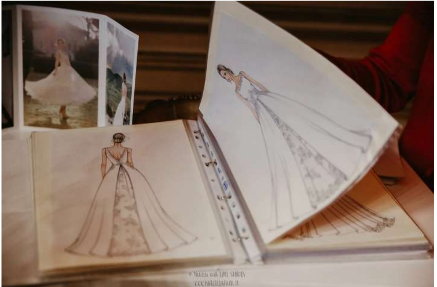
La Vie en Blanc Atelier

L'importanza di saper strutturare la propria Maison di abiti da sposa in modo da gestire oculatamente ogni aspetto delle attività da svolgere, delegandole a professionisti formati internamente o esternalizzandole ad interlocutori qualificati, è il segreto per un successo che non può prescindere dalla conoscenza profonda del mercato, nazionale ed estero, e degli andamenti capaci di intercettare flussi commerciali e potenziali canali distributivi.