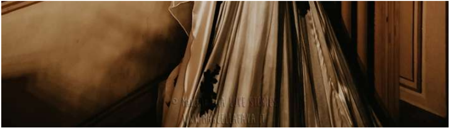
Abito La Vie en Blanc Atelier